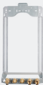
Fácil reemplazo: Dimensiones compactas

Destacan sus reducidas dimensiones, además de conexiones electrónicas sencillas y accesibles sin apertura de la carcasa, ya que cuenta con un mecanismo de abatimiento de robusto lo que permite instalar la caldera dentro o entre armarios, de cocina.